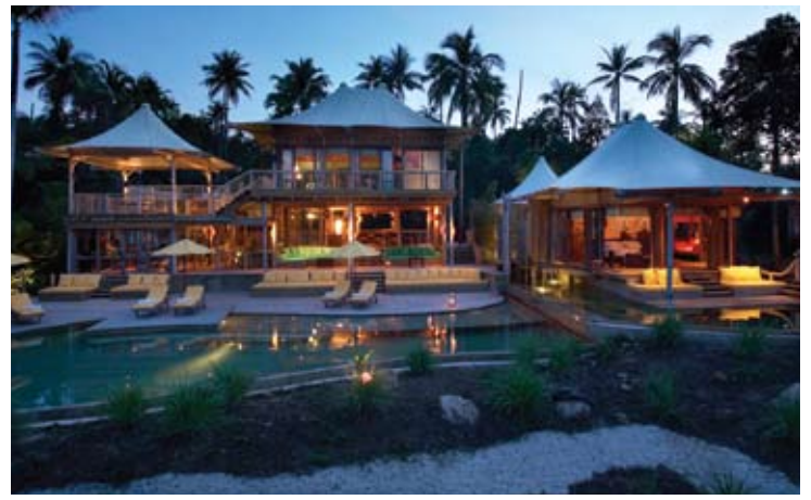
Beach Villa Suite