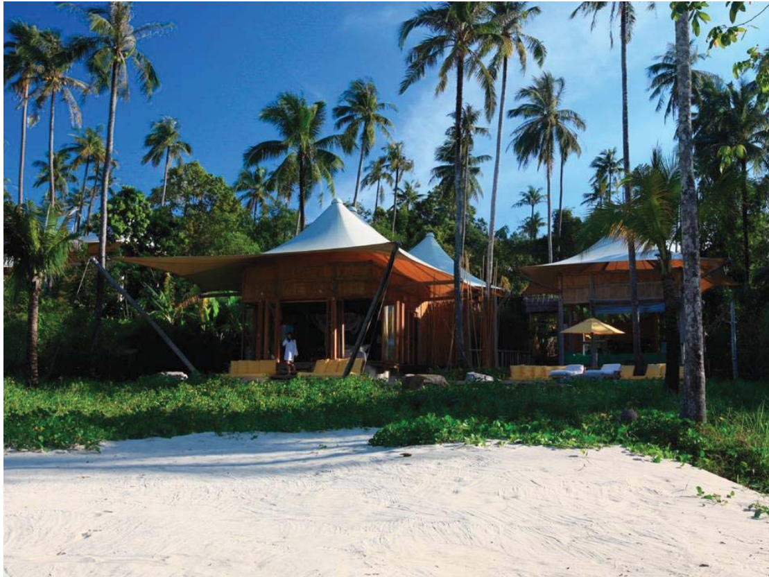
Beach Villa Suite