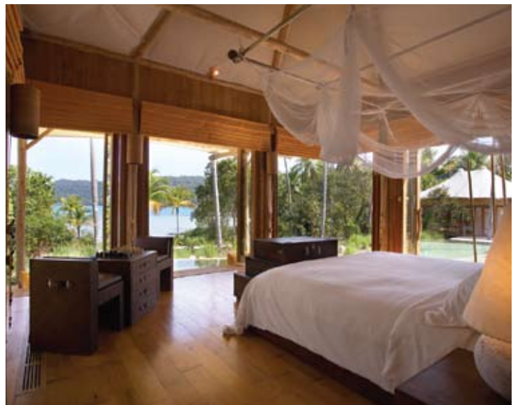
Beach Villa Suite Bedroom