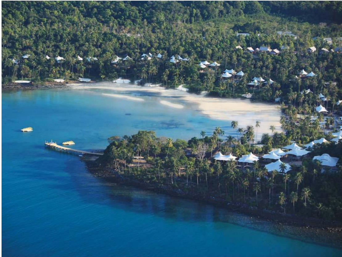
Aerial View of Soneva Kiri