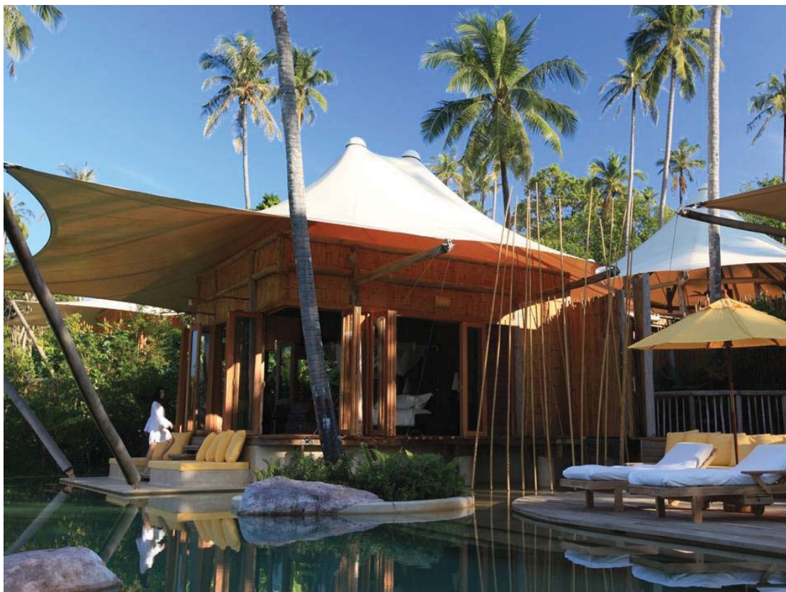
Beach Villa Suite