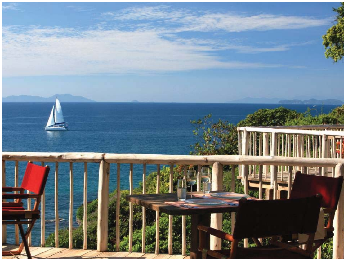
Fine Dining Restaurant