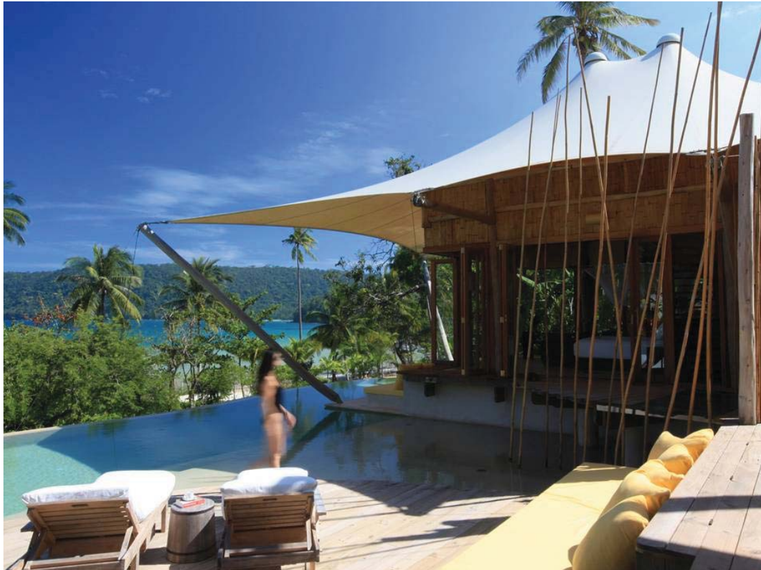
Beach Villa Suite