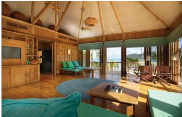
Beach Villa Suite Livingroom