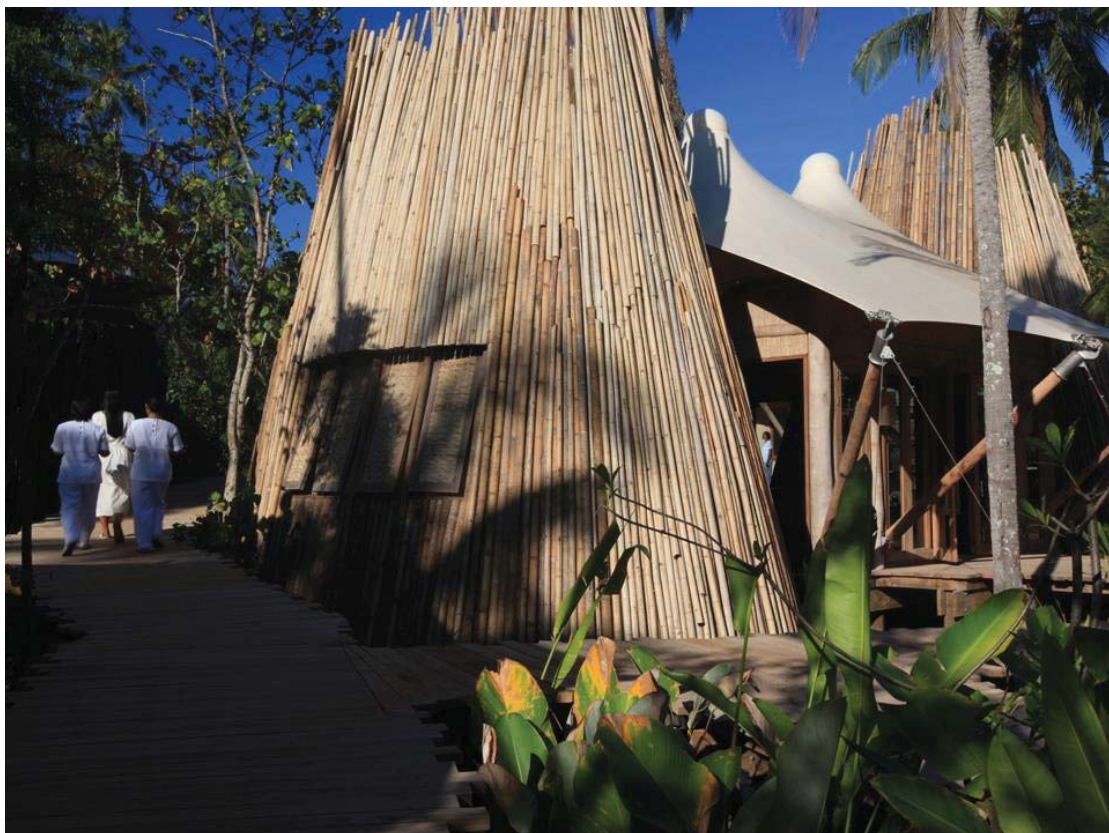
Six Senses Spa