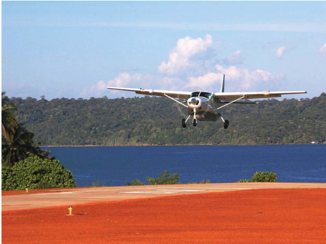
Soneva Kiri plane at Soneva Kiri Airport