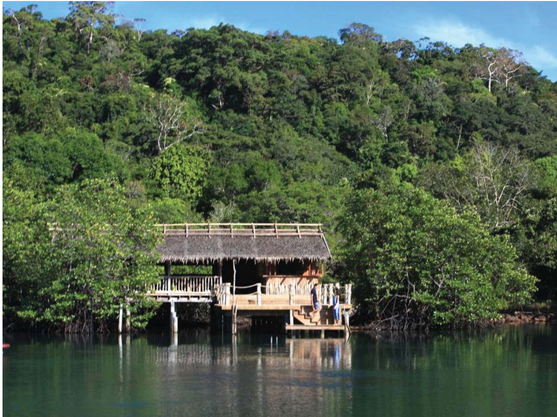
Khun Benz Restaurant